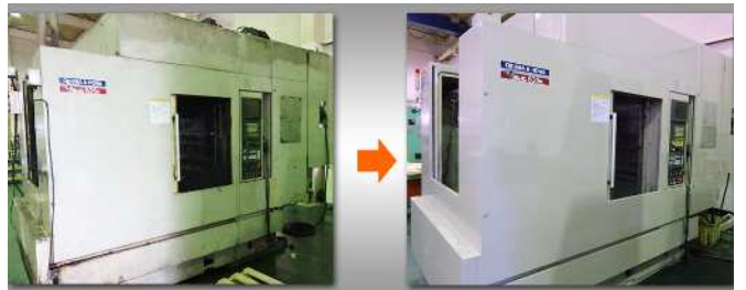
OKUMA & HOWA_MILLAC-525H