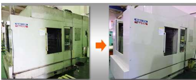
OKUMA & HOWA_MILLAC-525H