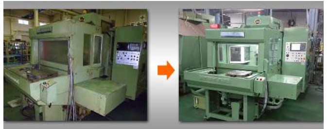
日立精機_HC400_NC (FANUC 0i-TF)