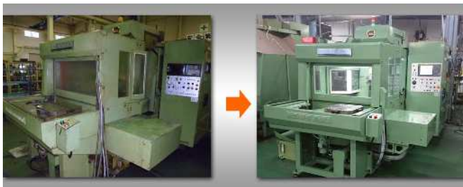
日立精機_HC400_NC (FANUC 0i-MF)