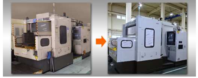
三菱重工業_M-H50C_NC (FANUC 0i-MF)